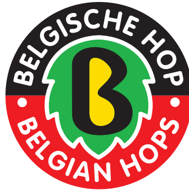
Nederlands / Engels

Het logo wordt steeds gebruikt met de witte rand rond het logo. Deze maakt integraal deel uit van het logo. Op een witte fond is deze niet zichtbaar.