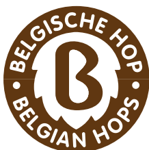
Logo 1 kleur