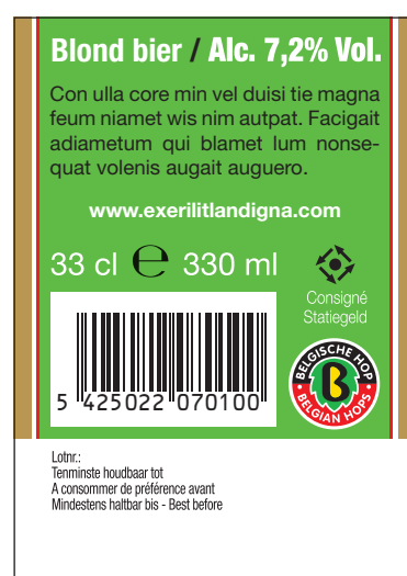
Rugetiket - minimumformaat Ø 11 mm