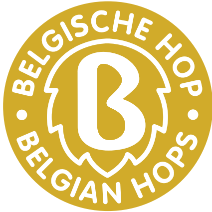
Logo Goudgeel - CMYK