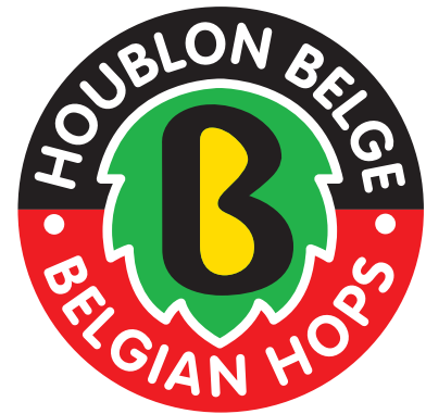
Frans / Engels